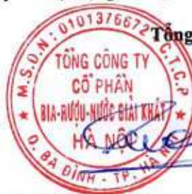
Ngô Quế Lâm